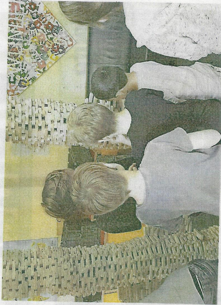
Klötzchen für Klötzchen wurde aufgestapelt.